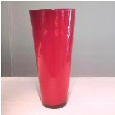
Vase Alex - rot, h65 d30 - weiss, h65 d30 - rot, h45 d25

Das hochwertige, mundgeblasene Glas wird hergestellt in Glashütten in Belgien, Frankreich und der Tschechei. Das spezielle an den Gläsern ist die Farbe, welche in das Glas ‚gedreht‘ wird.